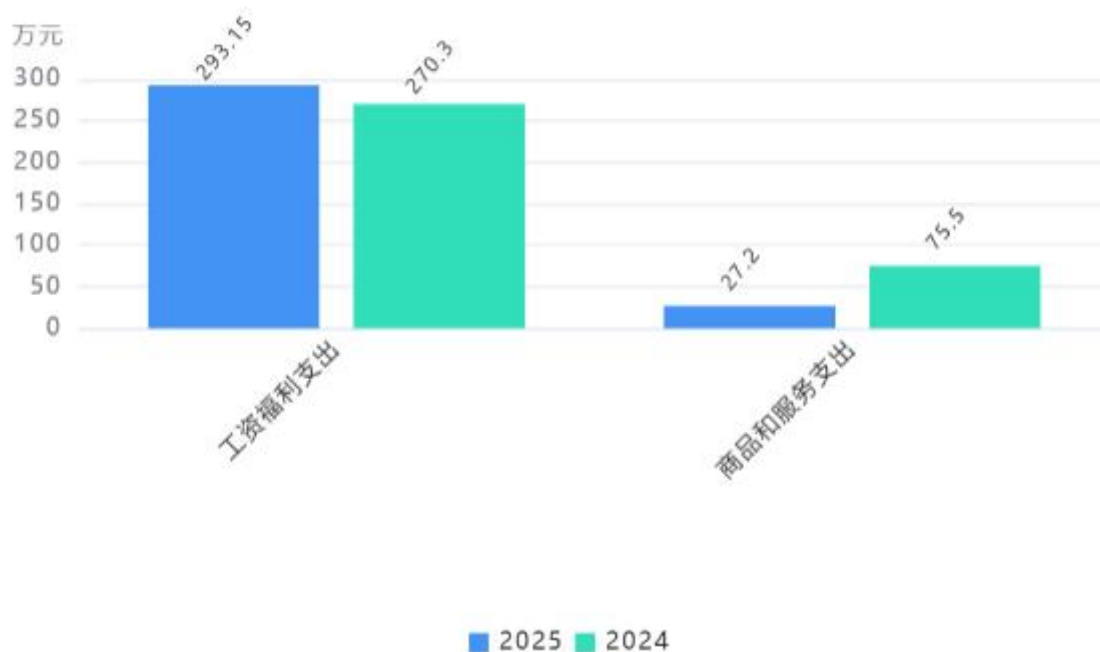
支出按部门预算支出经济分类对比图

2. 按照政府预算支出经济分类，本单位当年一般公共预算支出320.35万元，其中：